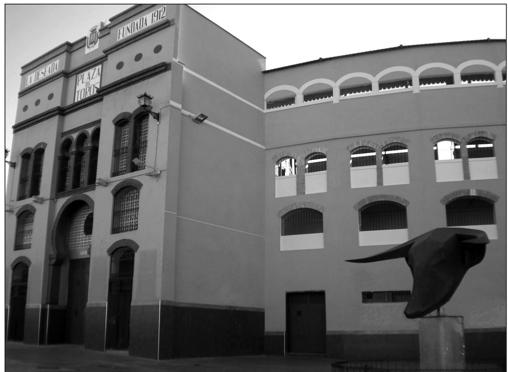
Plaza de toros en la actualidad.