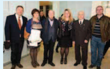
Autoridades, comisarios de la exposición e inventores.