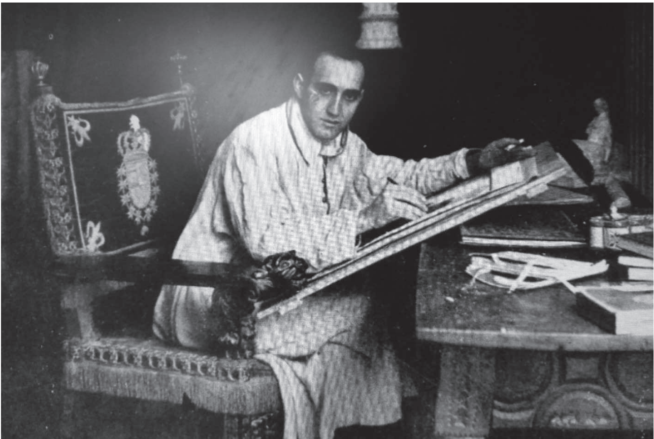
El escultor Julio Antonio