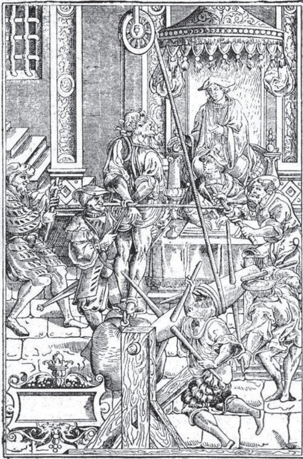
Ilustración 2: El suplicio de la cuerda. Grabado publicado en una revista del año 1904.

tos tuvieron lugar el 7 de junio de 1557, día en el que murieron abrasados en la hoguera once personas, el 12 de febrero de 1559 cuando murieron atrocemente otros treinta murcianos entre terribles gritos, el 4 de febrero del siguiente año en el que fueron quemadas otras catorce personas, el 8 de ese mes de septiembre en que lo fueron dieciséis. El 15 de marzo de 1562 fueron llevadas al “braser” veintitrés víctimas y el 20 de mayo de 1563 otras diecisiete.