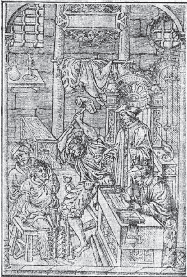
Ilustración 3: El tormento de los bordegües. Id que la anterior

de Jesucristo, señalando que aliviaba males con conjuros, reliquias y remedios.