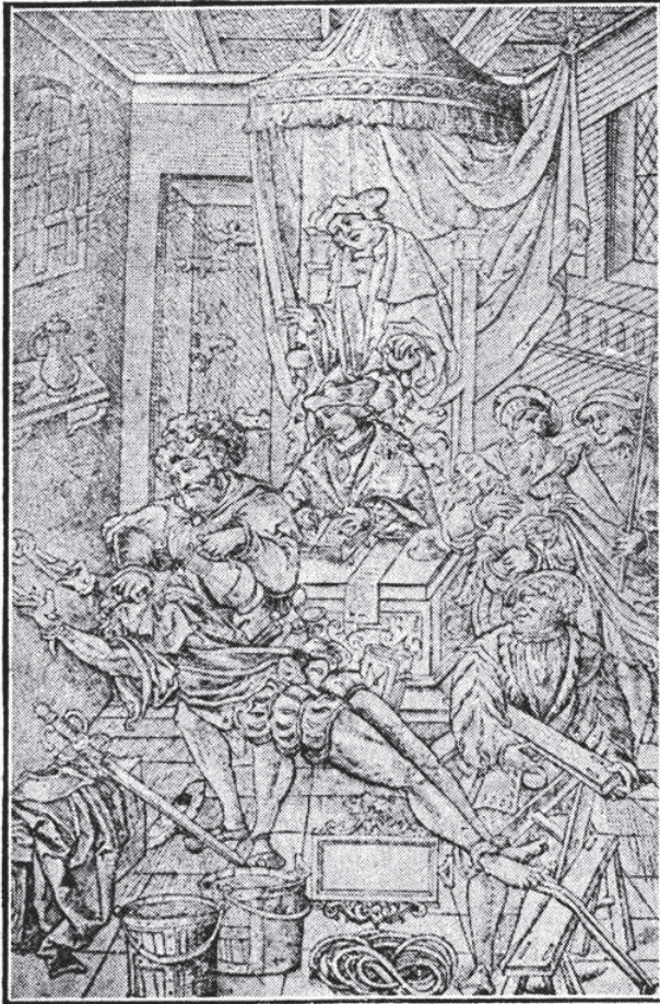
Ilustración 4: Otros tipo de tormento. Id. anterior

capacidad de censurar textos, mermando así sus facultades. La posición de los liberales en el asunto se vio reforzada por inteligentes folletistas que ganaron a la opinión pública, consiguiendo la victoria el 22 de enero de 1813 por lo que un decreto del mes siguiente establecía su abolición, aunque en realidad no la abolía sino que la declaraba “incompatible con la Constitución” y devolvía a los obispos la jurisdicción en materias de fe y herejía, aunque estos protestaron la medida negándose a reconocerla.